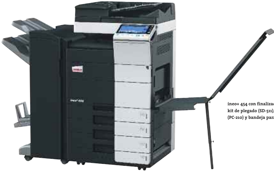
ineo+ 454 con finalizador grapador (FS-534), kit de plegado (SD-511), cassette de papel (PC-210) y bandeja para pancartas (BT-C1e)