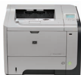
Impresora HP LaserJet empresarial P3015