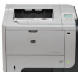
Impresora HP LaserJet empresarial P3015dn