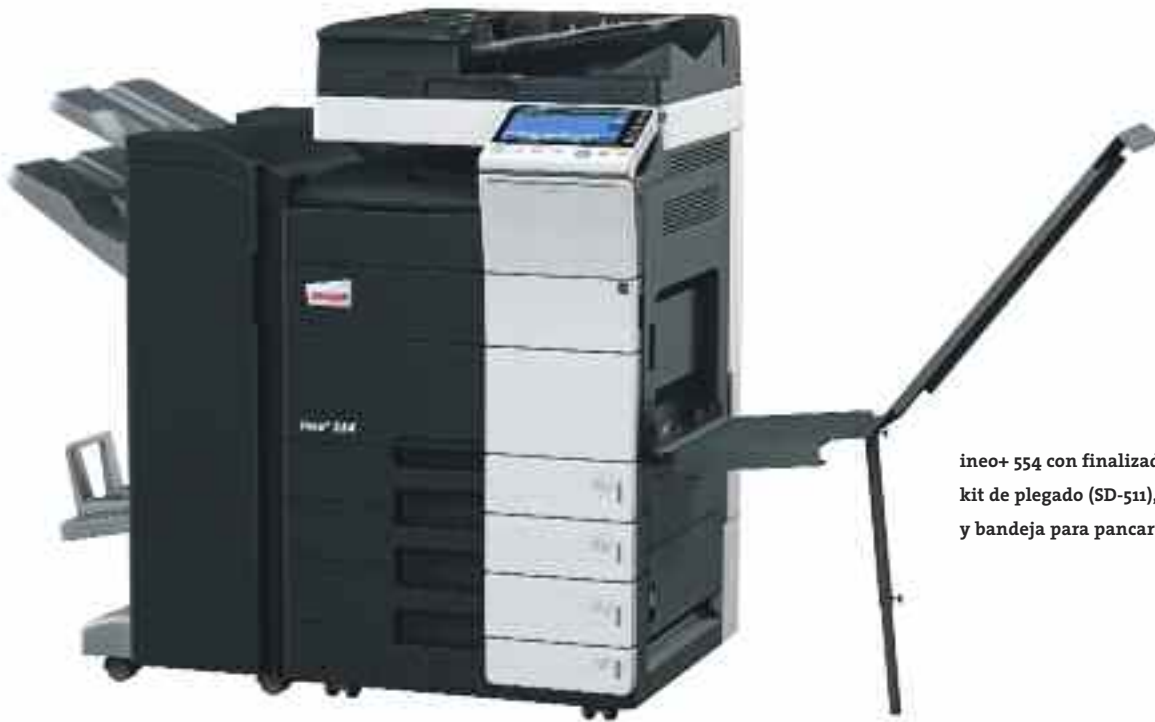
ineo+ 554 con finalizador grapador (FS-534), kit de plegado (SD-511), cassette de papel (PC-210) y bandeja para pancartas (BT-C1e)