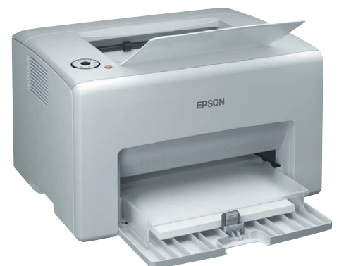
La AcuLaser C1700 Series ocupa lo mismo que una impresora de escritorio