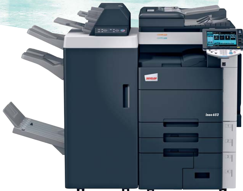
ineo 652 con grapadora (FS-526), kit de plegado (SD-508) y post inserter (PI-505)