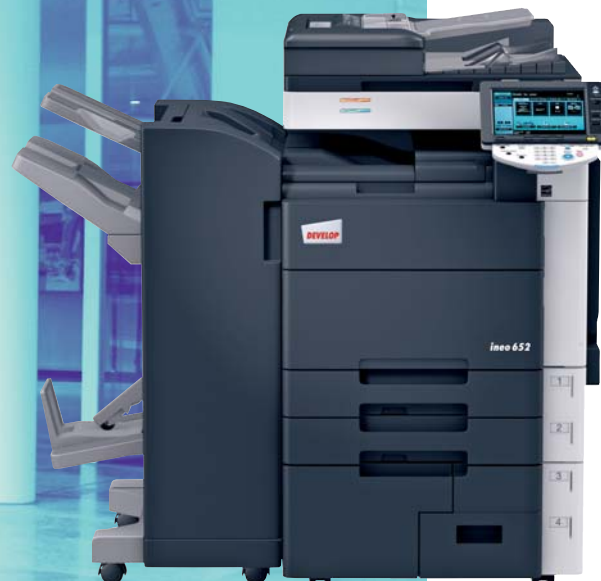
ineo 652 con grapadora (FS-527), kit de plegado (SD-508) y separador de trabajos (JS-603)