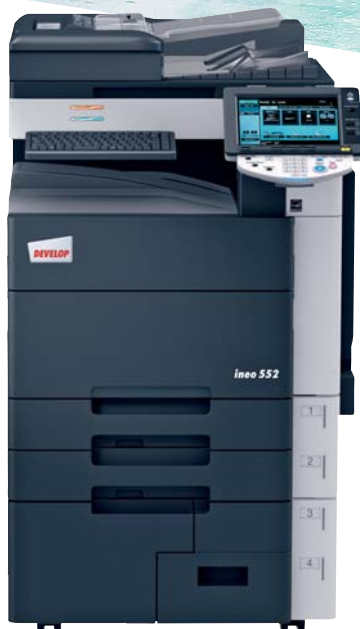
ineo 552 con bandeja de salida (OT-503), soporte de teclado (KH-101) y teclado externo