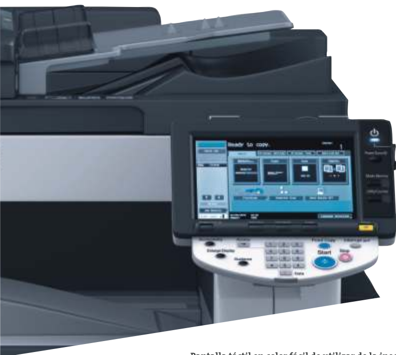
Pantalla táctil en color fácil de utilizar de la ineo 223

La alta calidad de impresión, unida a la amplia gama de funciones de acabado, permite imprimir en la propia empresa documentos de oficina profesionales, como por ejemplo folletos. Si a ello le añadimos la posibilidad de perforar y grapar, la productividad de la oficina mejora todavía más.