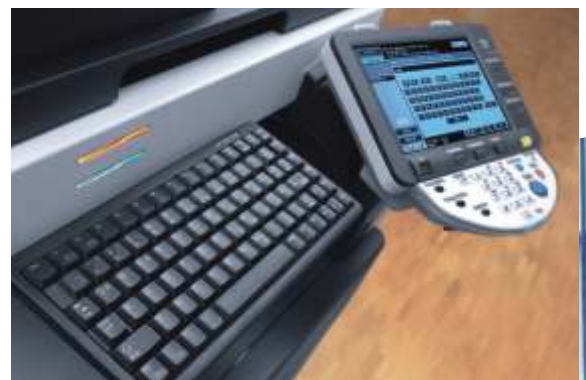
Pantalla táctil en color y teclado opcional de la ineo 223

El equipo perfecto: la ineo 223 para las impresiones y copias monocromas y los sistemas de color ineo+ para los trabajos en color profesionales. Beneficiarse de una combinación rentable para la producción de documentos profesionales de alta calidad.