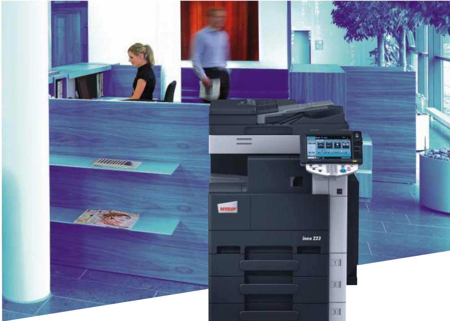
ineo 223 con finalizador integrado (FS-529), bandeja de papel (PC-208) y alimentador de documentos (DF-621)